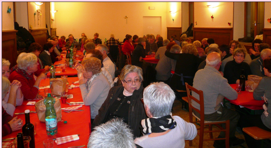
LA SALA CON I CONVITATI

GRAZIE A TUTTI I: E' STATA UNA BELLISSIMA SERATA!