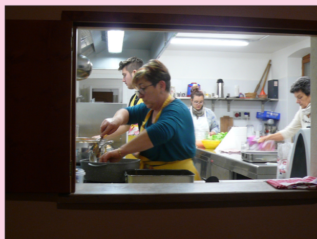
UNO SCORCIO IN CUCINA CON LE BRAVE CUOCHE