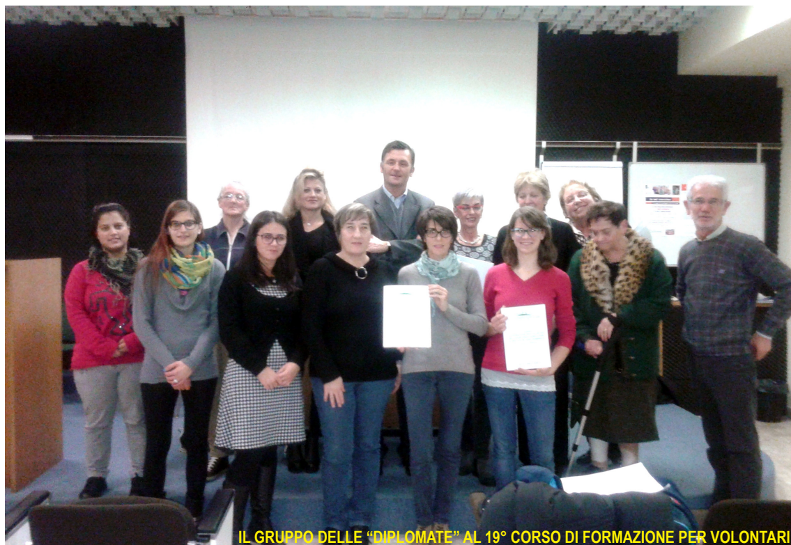
IL GRUPPO DELLE "DIPLOMATE" AL 19° CORSO DI FORMAZIONE PER VOLONTARI

Mano Amica, in considerazione che anche la terapia intensiva è parte degli interventi che possono essere utilizzati dai malati in fase terminale, ha deciso di aderire al progetto mediante intervento di sostegno finanziario, secondo quanto sarà concordato fra il presidente e il primario.