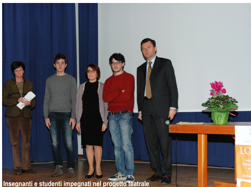
Insegnanti e studenti impegnati nel progetto teatrale