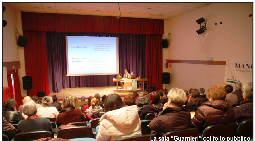
La sala "Guarnieri" col folto pubblico

Il titolo dato all'incontro, " A PICCOLI PASSI Stato di avanzamento della L. 38/2010 ", voleva mettere in evidenza come nella nostra realtà locale si stia avanzando con costanza nella realizzazione dei servizi previsti dalla legge, ma senza squilibri, cioè