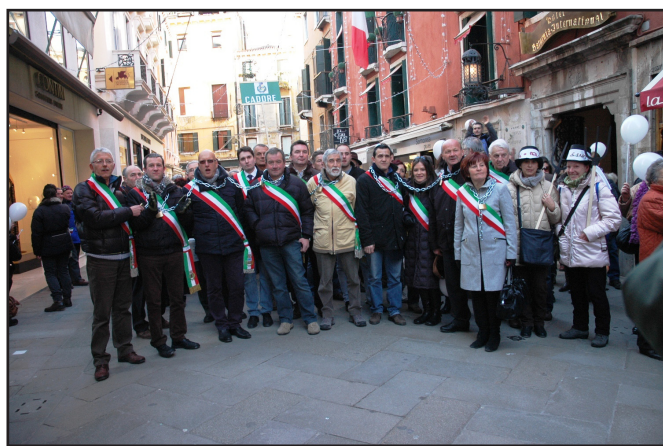
I SINDACI INCATENATI DAVANTI A PALAZZO FERRO FINI