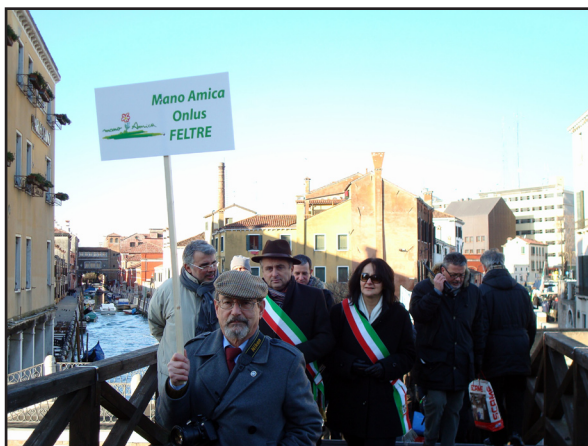
IL NOSTRO VICE PRESIDENTE APRE IL CORTEO