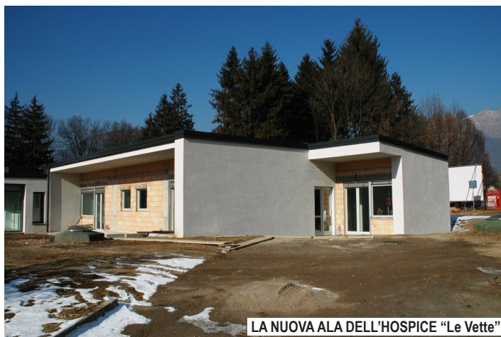
LA NUOVA ALA DELL'HOSPICE "Le Vette"

Altro importante intervento di Mano Amica sarà invece