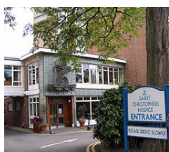
Il St. Christopher's Hospice fondato da Cicely Saunders (1967)

L'attività dei nostri volontari (per la verità si tratta per la stragrande maggioranza di volontarie) si esplica a domicilio e soprattutto in hospice. A tale ultimo riguardo, sono stati resi noti i dati di presenza delle volontarie presso l'hospice "Le Vette" durante l'anno scorso.