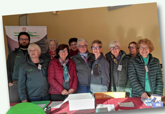
Un gruppo di volontari