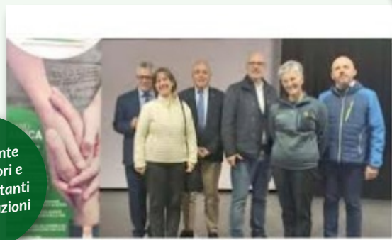
La Presidente con i relatori e i rappresentanti delle istituzioni