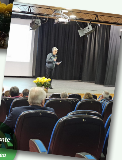
La Presidente saluta l'assemblea